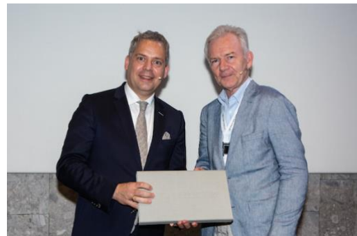
Overhandiging Streefbeeld Wegh der Weegen